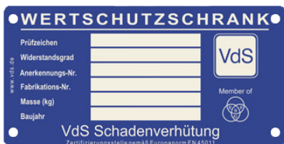
Beispiel Typenschild VdS-Tresore

Sehr geehrter Kunde, bitte bewahren Sie dieses PDF sorgfältig auf. Serienmäßig erhalten Sie mit Ihrem Tresor zwei Doppelbartschlüssel. Für Ersatz- oder Nachbestellungen verwenden Sie bitte dieses Formular. Bei Tresormodellen mit den hier abgebildeten Typenschildern können aus Sicherheitsgründen Ersatzschlüssel nur nach Vorlage eines Originalschlüssels angefertigt werden. Diese Vorschriften wurden zu Ihrer Sicherheit vom Verband der Schadenversicherer VdS in Köln herausgegeben.